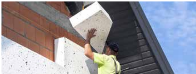
Dispositif d'écorénovation du parc privé Mur Mur 2