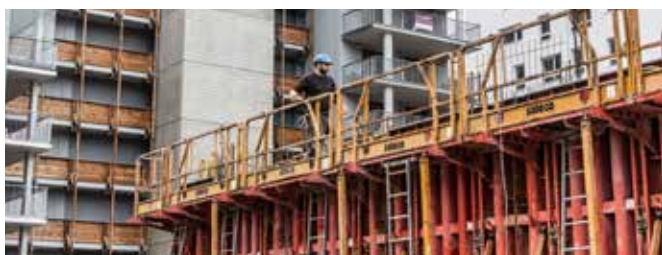
Soutien à la production de logements sociaux